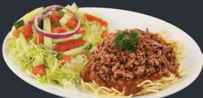
Combo demi spaghetti et salade verte