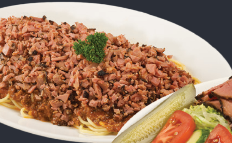
Spaghetti smoked meat